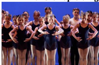
School voor Jong Talent

B este vrienden, partners en collega's, een spannend school jaar is voorbij en we kijken terug op tal van activiteiten. Nieuw is deze nieuwsbrief met informatie over de Dansvakopleiding.