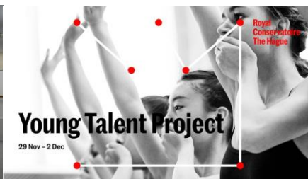
Young Talent Project 2017