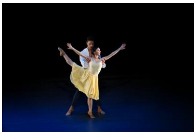
Lieder ohne Worte

Tijdens de presentatie van het nieuwe seizoen 2018/2019 van het Nederlands Dans Theater in het Zuiderstrandtheater, was ook het Young Talent Project te zien. Bachelor studenten dansten fragmenten uit Evening Songs .