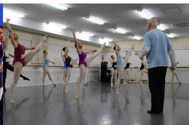
S&H Centre in Japan