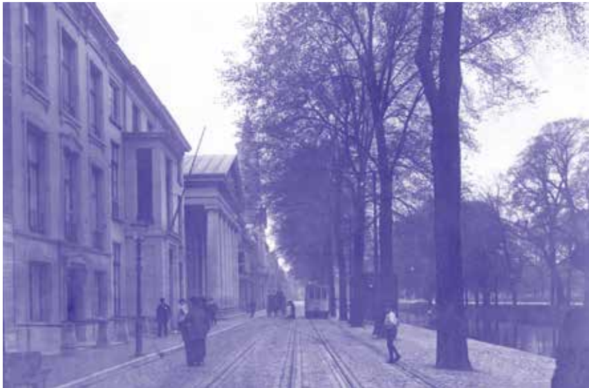
1840 Onder één dak met de Haagsche Teeken Academie (nu KABK)