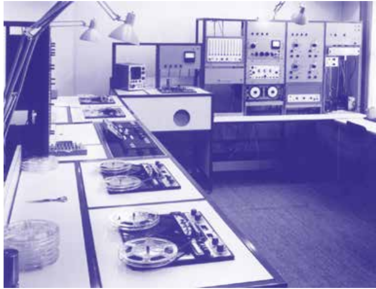
1967 De eerste studio voor elektronische muziek aan het Koninklijk Conservatorium