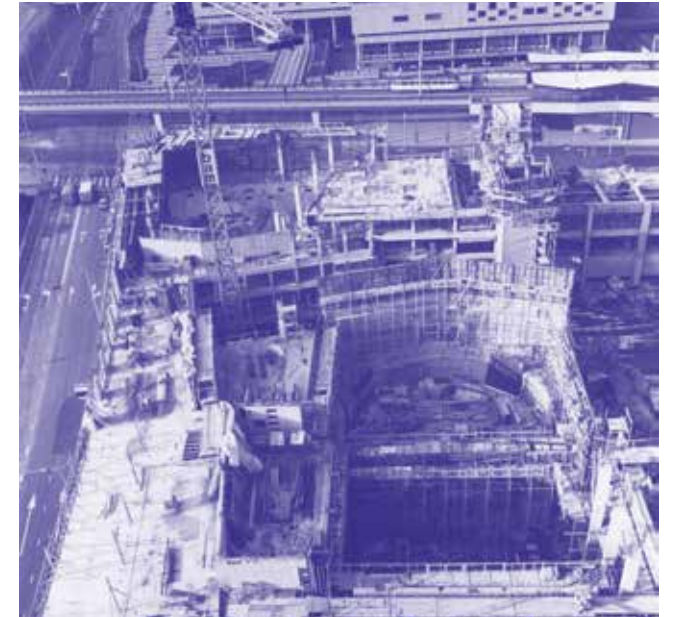
1976 Nieuwbouw aan de Juliana van Stolberglaan